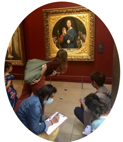
les stagiaires de la Promo 14