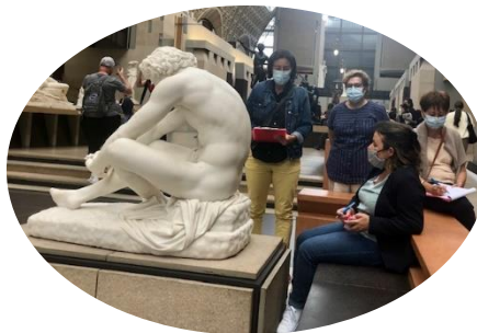
Collage réalisé par Annick TORRES, inspiré de la visite au musée