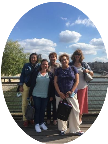
Visite au Musée d'Orsay avec