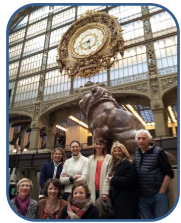
Visite au Musée d'Orsay afin d'expérimenter les techniques de CLEAN avec la Promo 9