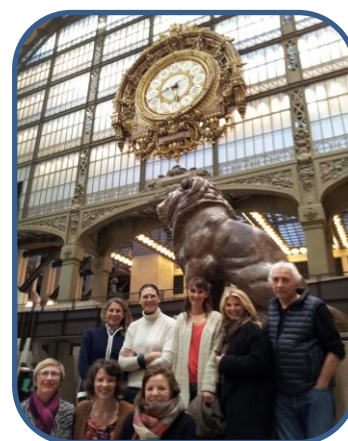
Visite au Musée d'Orsay afin d'expérimenter les techniques de CLEAN avec la Promo 9